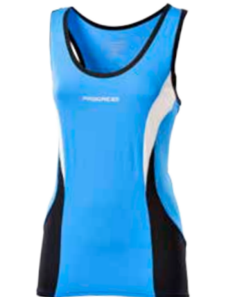
BIKE STUFF STELLA dámský cyklistický dres bez rukávů S-XL