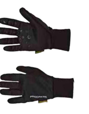
RUKAVICE ..... XS-XXL TREK GLOVES ..... XS-XXL

tenké rukavice s větruodolnou membránou a silikonem na dlaniích