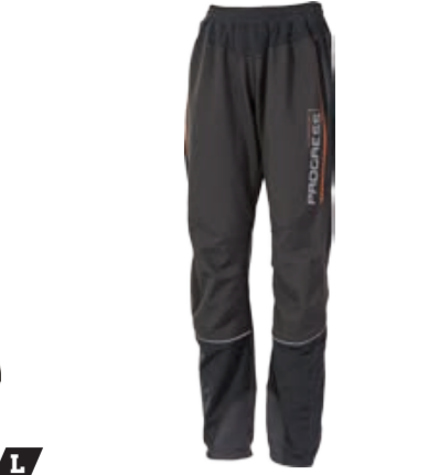
BIKE STUFF HORIZONT L dámské zimní elastické kalhoty s větru a vodě odolnou membránou S-XL