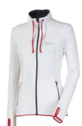
TECNOSTRETCH TULIPA dámská celopropínací mikina