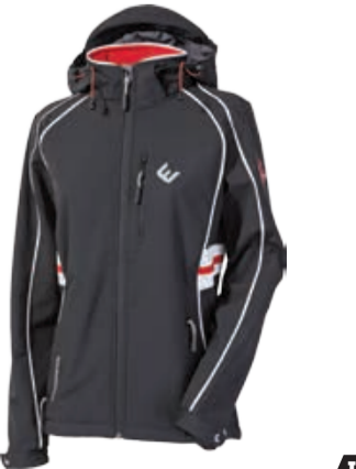
OUTDOOR STUFF ANDINA dámská softshellová bunda s odepínacími kapucí