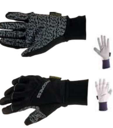
RUKAVICE ..... XS-XXL SNOWRIDE GLOVES ..... XS-XXL

fleecové prstové rukavice s větru/vodě odolnou membránou