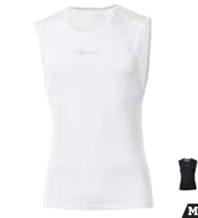
BIKE STUFF SEMILITE pánské scampolo S-XXL