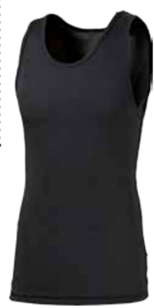
MICROSENSE MS NBR pánský nátečník bez rukávů