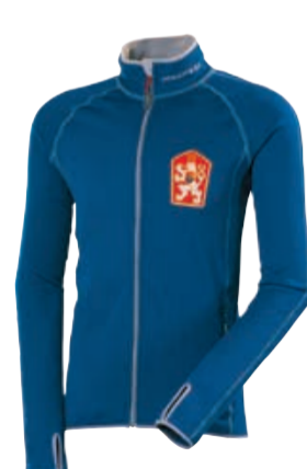
TECNOSTRETCH TIMUR pánská celopropínací mikina s kapucí