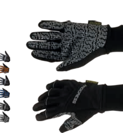
BIKE STUFF SNOWRIDE GLOVES zimní rukavice s větru a vodě odolnou membránou na dlaních XS-XXL