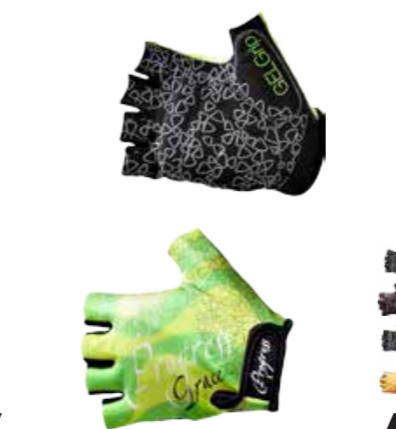
BIKE STUFF GRACE MITTS dámské bezprstové rukavice s gelovými plochami a silikonem na dlaních XS-L