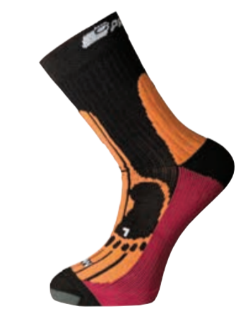
PONOŽKY 3-5, 6-8, 9-12 P MRN MERINO celarální ponožky s MERINO vlnou