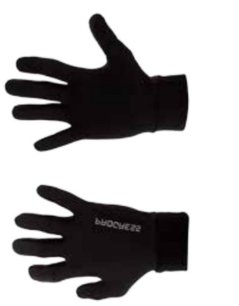
RUKAVICE ..... XS-XXL SLIMY ..... L