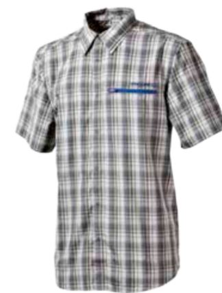
OUTDOOR STUFF ATTILA pánská košile s krátkým rukávem