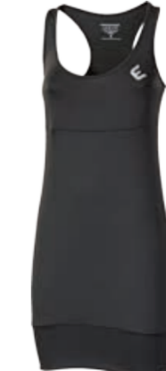
URBAN STYLE ADA dámské gletové šaty