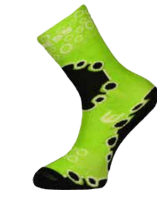
DĚTI 26-29, 30-34, 35-38 DT KSX dětské ponožky s merino vlnou