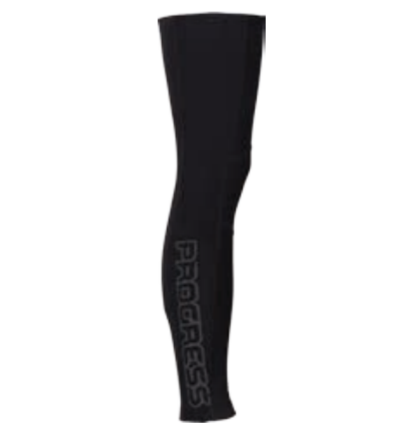
BIKE STUFF LEG + P1 zimní anatomické návleky na nohy s reflexním potiskem I, II, III