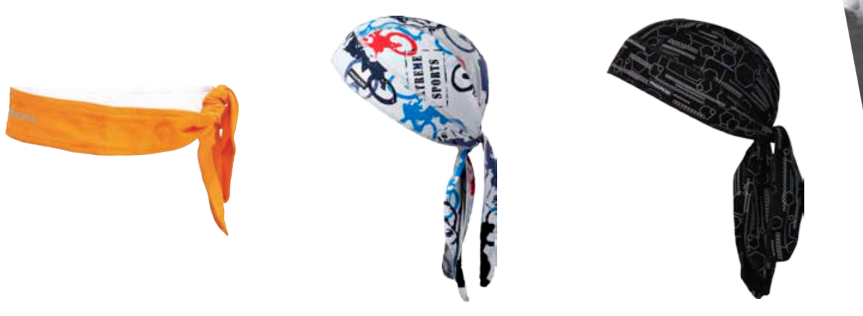
DOPLŇKY ..... UNI D CEL ..... čelenka DOPLŇKY ..... UNI D CEZ TISK ..... zavazovací pirát s potiskem DOPLŇKY ..... UNI D SAT TISK ..... trojčipý šátek s potiskem