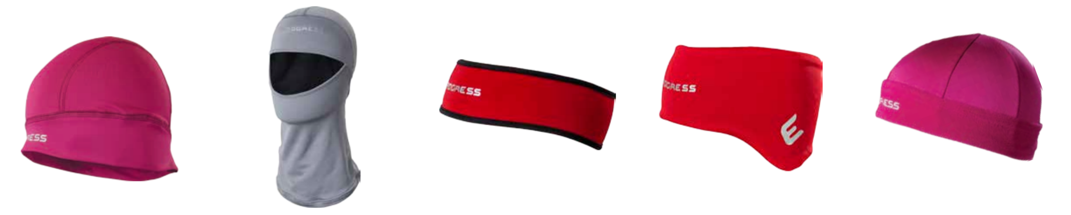
DOPLŇKY ..... UNI D DC CEP ..... čepice (Dynamic) DOPLŇKY ..... UNI D DC KUK ..... kukla (Dynamic) DOPLŇKY ..... UNI D TS CEL ..... čelenka (Tecnostretch) DOPLŇKY ..... UNI D TS CET ..... vyšší tvarovaná čelenka (Tecnostretch) DOPLŇKY ..... UNI D TS CEP ..... čepice (Tecnostretch)