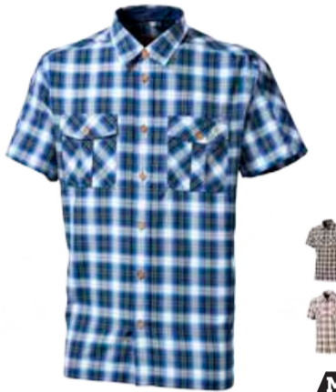
OUTDOOR STUFF PULSE pánská košile s krátkým rukávem

DE Die beste Mode zum Wandern und für Outdoor-Aktivitäten.