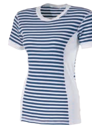
MICROLIGHT MLS NKRZ dámský nátečník s krátkým rukávem