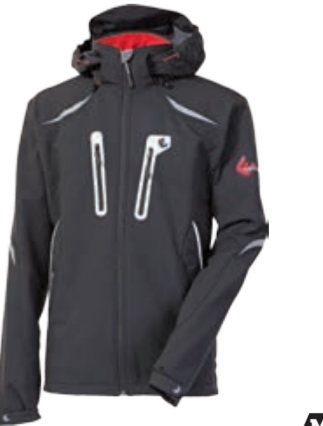
OUTDOOR STUFF KALAS dámská softshellová bunda s odepínacími kapucí