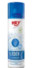
OŠETŘUJÍCÍ PROSTŘEDKY ..... 200 ML

HEY - IMPRA WASH Tekutý impregnační prostředek pro všechny funkční tkaniny a jiné syntetické a přírodní textilie (softshell). Napomáhá udržovat jejich voděodolnost a prodyšnost.