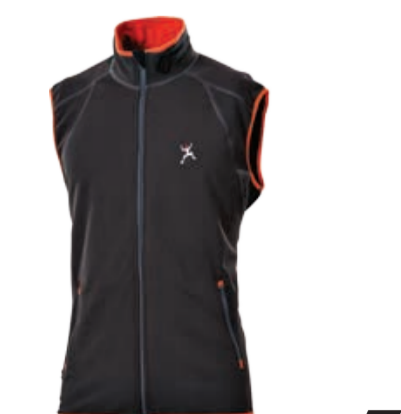
CLIMBING TARTAR ROCK pánská vesta