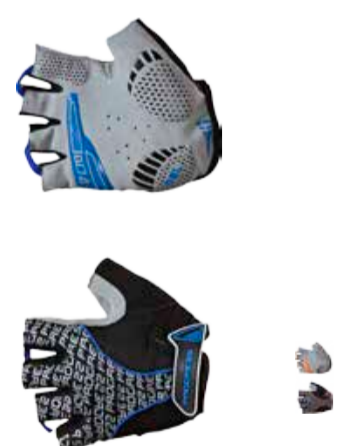
RUKAVICE ..... XS-XXL PULL MITTS ..... XS-XXL

bezprstové rukavice s pěnovými výstelkami na dlaniích