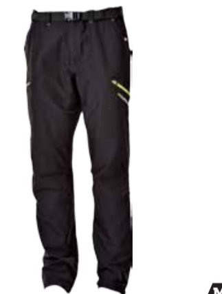
OUTDOOR STUFF AMETHYST pánské outdoorové kalhoty