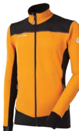
TECNOSTRETCH ROFAN pánská celopropínací mikina s technickými prvky pro outdoorové aktivity