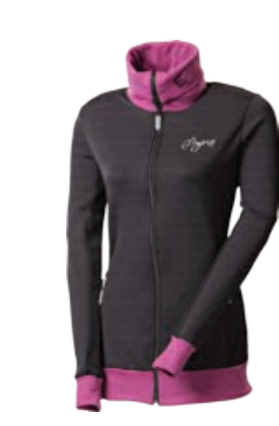
TECNOSTRETCH PRETTA dámská celopropínací mikina (pigmentový tisk – drobné káro)