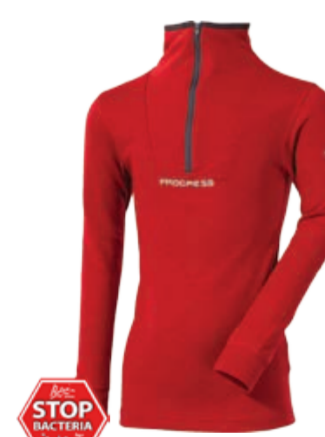
DĚTI 116, 128, 140, 152, 164 WS TRZD dětské tričko s dlouhým rukávem a stojáčkem na zip