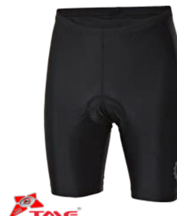
BIKE STUFF SIMPLE M pánské krátké elastáky s vložkou M-XXL