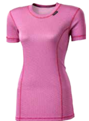
MICROSENSE MS NKRZ dámský nátečník s krátkým rukávem