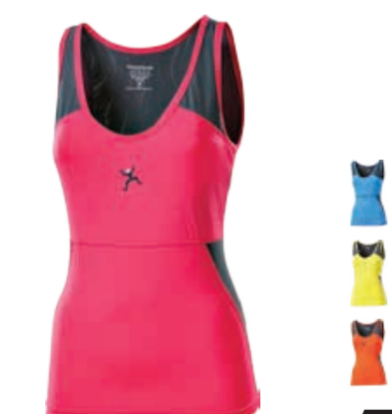
CLIMBING ARCO dámské triko bez rukávu