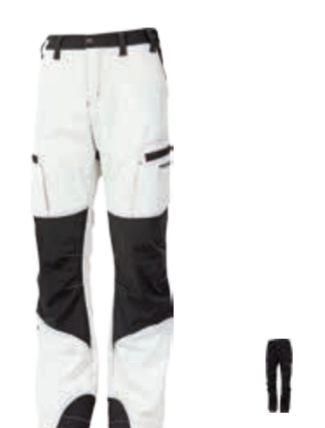
OUTDOOR STUFF KANDAHAR pánské zateplené turistické kalhoty s Cordurou