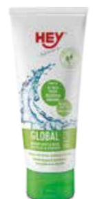
OŠETŘUJÍCÍ PROSTŘEDKY ..... 100 ML

HEY - TEX WASH Prací prostředek, který spolehlivě čistí všechny membránové textilie a přitom zachovává funkčnost a barvu těchto materiálů. Neutralizuje nepříjemné pachy. Vhodný pro všechny typy membrán: GoreTex, Schoeller, a tak podobně. Doporučujeme používat v kombinaci s IMPRA wash-in impregnačním prostředkem.