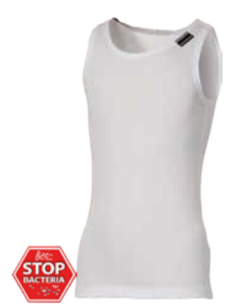
DĚTI 116, 128, 140, 152, 164 MS NBRD dětský nártelník bez rukávů