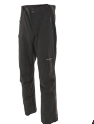
OUTDOOR STUFF VIDAR pánské kalhoty s podšívkou, kšandy, lepené švy, WP zipy, rozepínací spodní nohavice