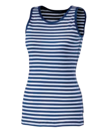
MICROLIGHT MLS NBRZ dámské tílko