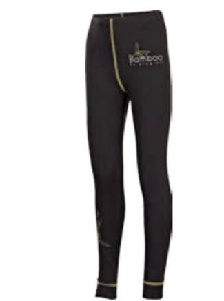
DĚTI 116, 128, 140, 152, 164 E SDND dětské dlouhé spodky (Bamboo)