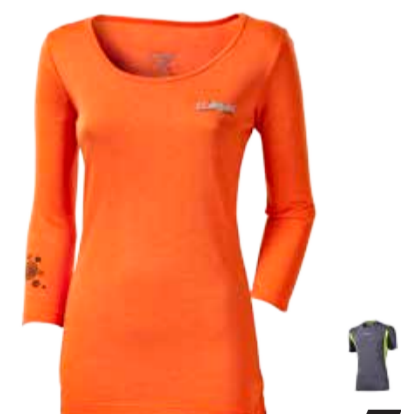
CLIMBING POKHARA dámské triko s ¾ rukávem