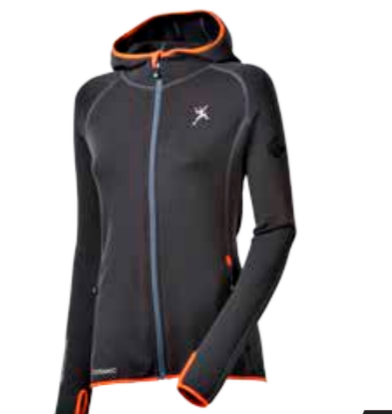
CLIMBING TAMPA ROCK dámská celopropínací mikina