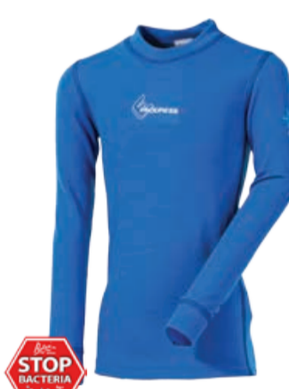
DĚTI 116, 128, 140, 152, 164 WS TDRD dětské tričko s dlouhým rukávem