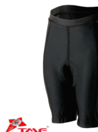
DĚTI 116, 128, 140, 152 BEE dětské šestipanelové cyklošorty s vložkou