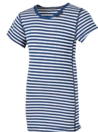
DĚTI 116, 128, 140, 152, 164 MLS NKRD dětský námořnický nártelník s krátkým rukávem