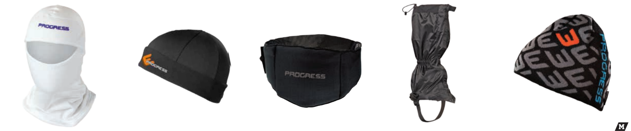
DOPLŇKY ..... UNI D TS KUK ..... kukla (Tecnostretch) DOPLŇKY ..... UNI D NW CEP ..... čepice s neprofkuk membránou v přední části DOPLŇKY ..... XS/S, M/L, XL/XXL D BED ..... bederní pás DOPLŇKY ..... S/M, L/XL D SNOW GAITERS ..... celopropracovaná sněžná návleky DOPLŇKY ..... M D HUMP ..... pánská pletená čepice