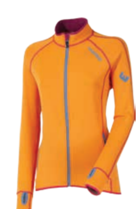
TECNOSTRETCH TISPA II. dámská celopropínací mikina