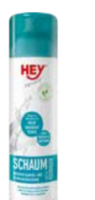
OŠETŘUJÍCÍ PROSTŘEDKY ..... 250 ML

HEY - SAFETY WASH Dezinfikuje, zabírá vlnu nepříjemnému zápachu a bakteriím. Výrobek s novým deo-efektem (antibakteriální úprava). Odstraňuje z textilií nepříjemné pachy, houby, zárodky bakterií a to i při nižších teplotách. Čistí a zabezpečuje světlé.