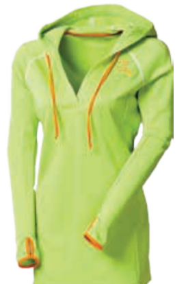
URBAN STYLE NIBA dámská mikina s kapucí