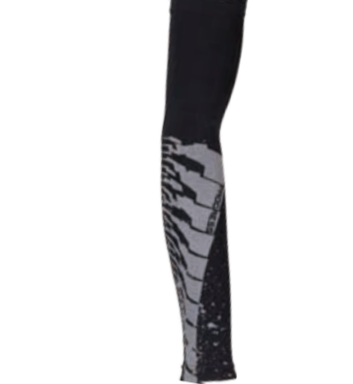
BIKE STUFF ARM P1 návleky na ruce s reflexním potiskem I, II, III