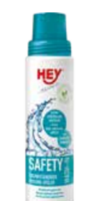
OŠETŘUJÍCÍ PROSTŘEDKY ..... 250 ML

HEY - MICRO WASH Obnovuje vlastnosti mikrovláken a fleecu. Udržuje stálobarevnost, jas a působí antistaticky a s deo-efektem.