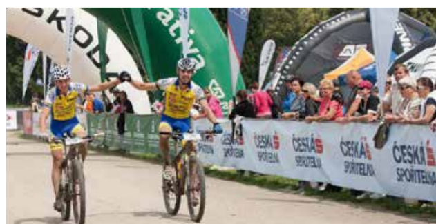
◀ SK SKIVELE NESLYŠÍCÍCH OLOMOUC