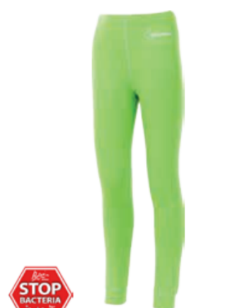
DĚTI 116, 128, 140, 152, 164 WS SDND dětské dlouhé spodky