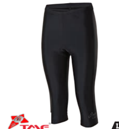
BIKE STUFF SIMPLE L 30 dámské % elastáky s vložkou S-XL