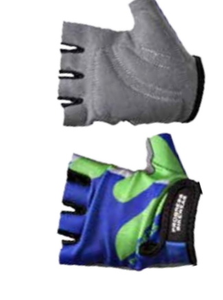
DĚTI XS, S, M KIDS MITTS dětské bezprstové rukavice