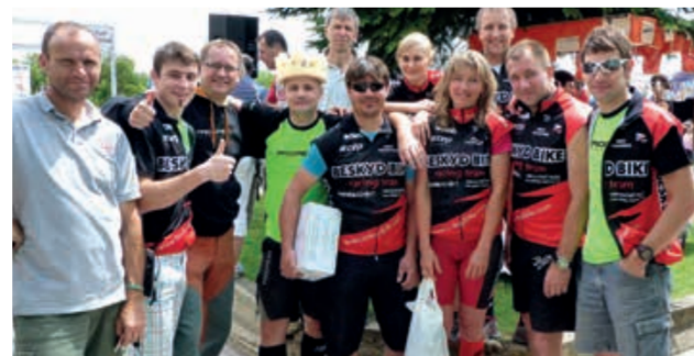
◀ BESKYD BIKE MTB