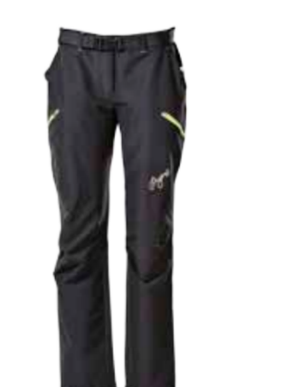
OUTDOOR STUFF AGATE dámské outdoorové kalhoty