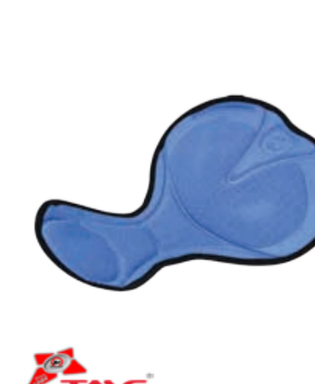
BIKE STUFF PAD MUŽI pánská samodržící protiskluzová vložka UNI