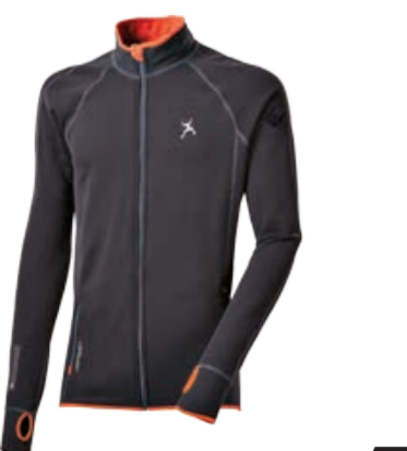
CLIMBING TAREZ ROCK pánská celopropínací mikina