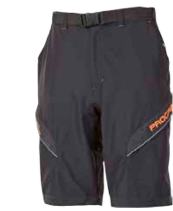
BIKE STUFF FREERIDER SHORTS pánské šortky s odepínacími elastáky s vložkou M-XXL