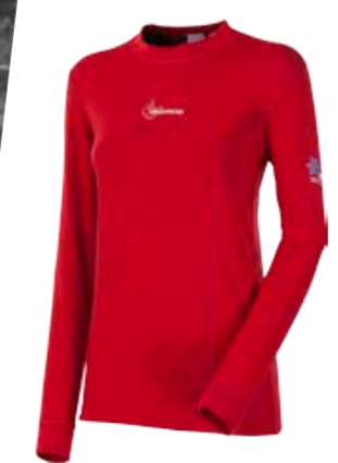
WINTER SENSE WS TDRZ dámské triko s dlouhým rukávem