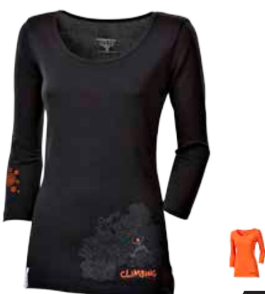
CLIMBING POKHARA PRINT dámské triko s ¾ rukávem a potiskem