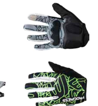
BIKE STUFF SPIDER GLOVES lehké cyklistické rukavice s silikonem na dlaních XS-XXL