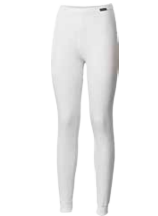
MICROSENSE MS SDNZ dámské dlouhé spodky