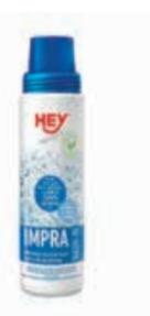
OŠETŘUJÍCÍ PROSTŘEDKY ..... 250 ML

HEY - IMPRA HELM FRESH Čistící pěna pro helmy s absorbentem zápachu. Spolehlivě čistí a dezinfikuje helmy. Lze použít na motocyklové, cyklistické, jezdecké a lyžařské helmy zevnitř i zvenčí. Neničí jemný materiál na helmách. Neutralizuje neblahý oduř.