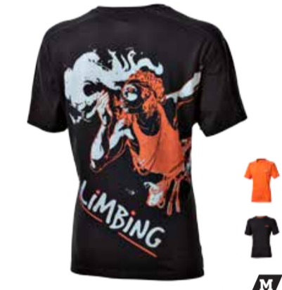
CLIMBING TIBET PRINT pánské triko s krátkým rukávem, potisk na zádech