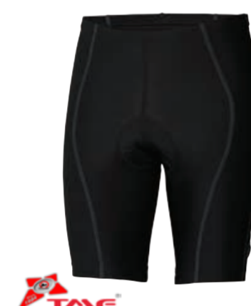
BIKE STUFF ACTIV pánské krátké osmipanelové elastáky s vložkou M-XXL