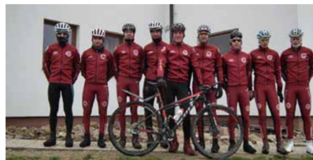
◀ AC SPARTA PRAHA CYCLING O.S. silniční cyklistika