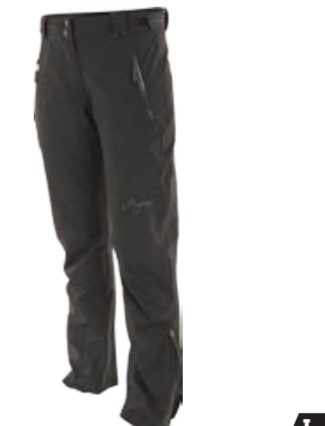
OUTDOOR STUFF FULLA dámské kalhoty s podšívkou, lepené švy, WP zipy, rozepínací spodní nohavice