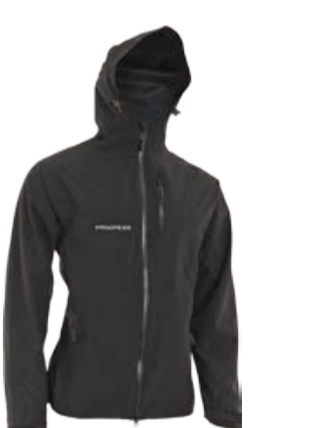
OUTDOOR STUFF THOR pánská lehká sportovní bunda s podšívkou, lepené švy, WP zipy