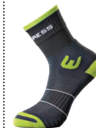
PONOŽKY 3-5, 6-8, 9-12 P WLK WALKING SOX turistické letní ponožky