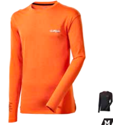
CLIMBING SIKKIM pánské triko s dlouhým rukávem