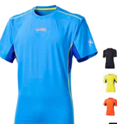
CLIMBING VERDON pánské triko s krátkým rukávem