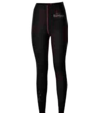
BAMBOO COLLECTION EKALZ dámské kalhotky