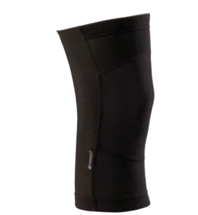
BIKE STUFF KNEE + zimní návleky na kolena I, II, III