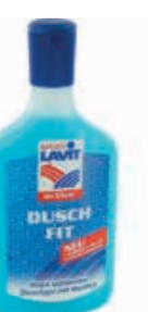
OŠETŘUJÍCÍ PROSTŘEDKY ..... 200 ML

HEY-GLOBAL WASH Cestovateľský čistící prostředek na tělo, ale i na prádlo, nádobí, aj. Přípravek je 100% biologicky rozložitelný.