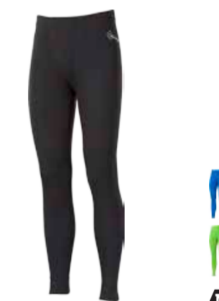
WINTER SENSE WS SDN pánské dlouhé spodky