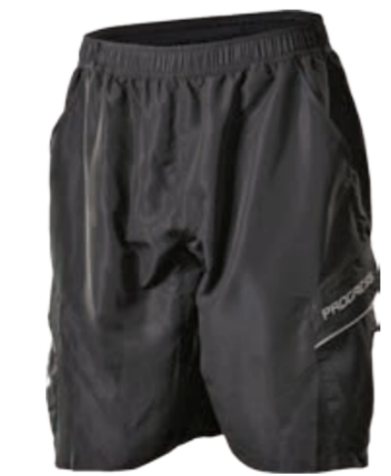
BIKE STUFF TRAIL SHORTS pánské šortky s odepínacími elastáky s vložkou M-XXL