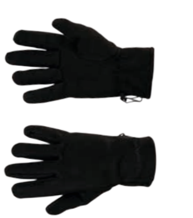
RUKAVICE ..... XS-XXL BLOCKWIND GLOVES ..... XS-XXL

zimní rukavice s větru/vodě odolnou membránou a silikonem na dlaniích