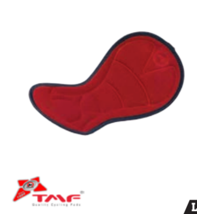
BIKE STUFF PAD ŽENY dámská samodržící protiskluzová vložka UNI