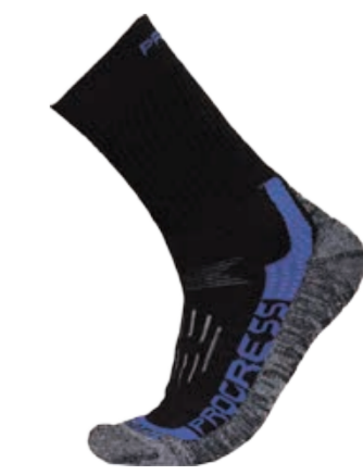
PONOŽKY 3-5, 6-8, 9-12 P XTR X-TREME zimní trekkingové ponožky s Merinom