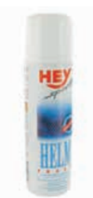
OŠETŘUJÍCÍ PROSTŘEDKY ..... 250 ML

HEY - DAUNEN WASH Ošetřuje a čistí oblečení, pošťáre a spacáky. Navrací jim původní objem. Vídecky testované. Hey sport DAUNEN wash houbkové čisti při a udržuje její pružnost. Houbkové čisti textilie. Zabraňuje slepení při dohromady a udržuje textilií vysoce elastickou a měkkou.