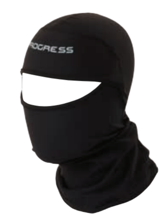
DĚTI UNI DT DCW KUK dětská kukla (Dynamic winter)