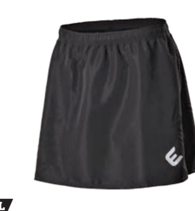
BIKE STUFF RONDA sukně s odepínacími elastáky s vložkou S-XL