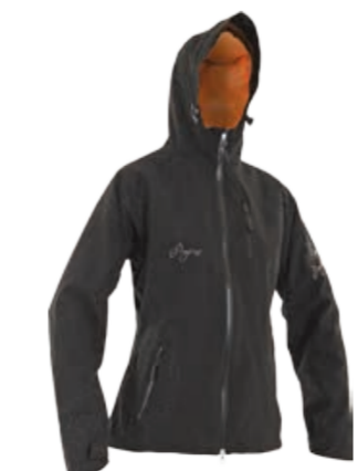
OUTDOOR STUFF VALKYRA dámská lehká sportovní bunda s podšívkou, lepené švy, WP zipy