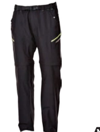
OUTDOOR STUFF CRYSTAL pánské outdoorové kalhoty s odepínacími nohavicemi