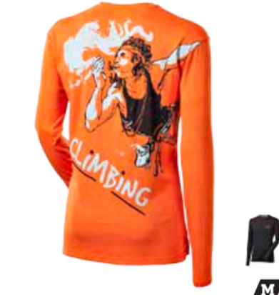
CLIMBING SIKKIM PRINT pánské triko s dlouhým rukávem