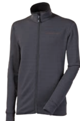
TECNOSTRETCH REMEDY pánská celopropínací mikina (pigmentový tisk – drobné káro)