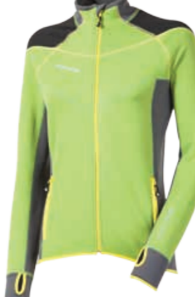
TECNOSTRETCH BRENTA dámská celopropínací mikina s technickými prvky pro outdoorové aktivity