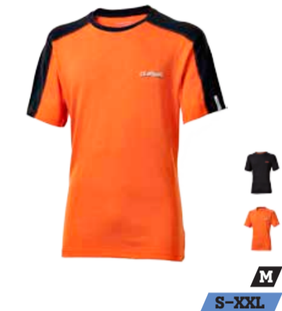
CLIMBING TIBET pánské triko s krátkým rukávem