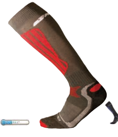
PONOŽKY 3-5, 6-8, 9-12 P XHI X-HIGH lyžařské podkolenky