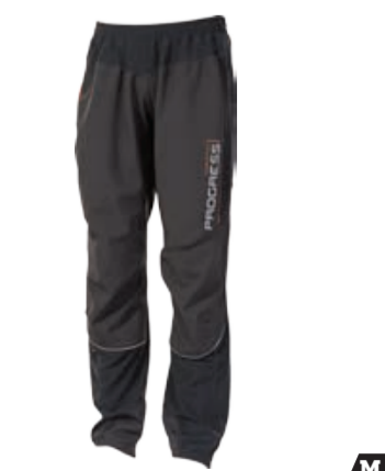
BIKE STUFF HORIZONT M pánské zimní elastické kalhoty s větru a vodě odolnou membránou M-XXL