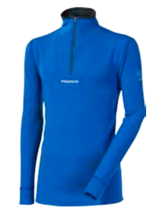
WINTER SENSE WS TRZ pánské triko s dlouhým rukávem a stojáčkem na zip