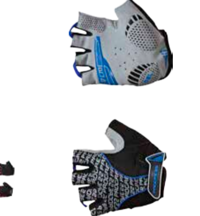
BIKE STUFF PULL MITTS bezprstové rukavice s gelem a silikonem na dlaních a s poučky pro snadnější stahování z ruky XS-XXL