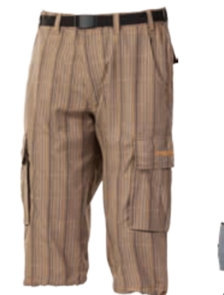
OUTDOOR STUFF OREB 30 pánské kostované ¾ kalhoty