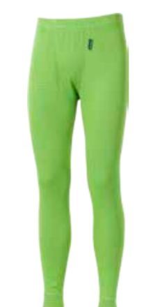
MICROSENSE MS SDN pánské dlouhé spodky