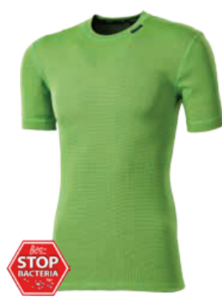
DĚTI 116, 128, 140, 152, 164 MS NKRD dětský nártelník s krátkým rukávem