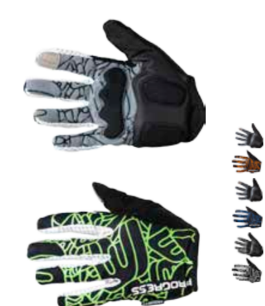
RUKAVICE ..... XS-XXL SPIDER GLOVES ..... XS-XXL

prstové rukavice s ochrannými prvky kloubů na hrabetu ruky