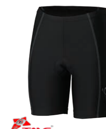
BIKE STUFF ELLE dámské elastické šestipanelové kraťasy s cyklovložkou S-XL