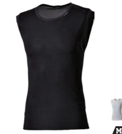
BIKE STUFF LITE pánské scampolo S-XXL

VÝRAZNÉ REFLEXNÍ BARVY PRO VYŠŠÍ BEZPEČNOST