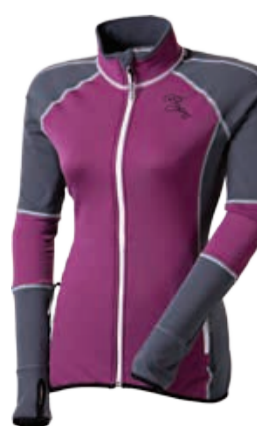
TECNOSTRETCH VISTA dámská celopropínací mikina