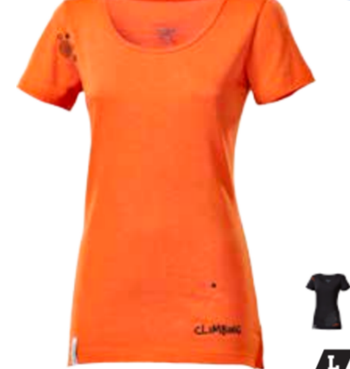
CLIMBING LHASA PRINT dámské triko s krátkým rukávem a potiskem