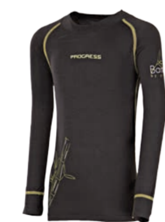
DĚTI 116, 128, 140, 152, 164 E NDRD dětské tričko s dlouhým rukávem (Bamboo)