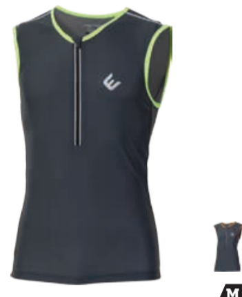
BIKE STUFF SPIDY pánský dres bez rukávů M-XXL