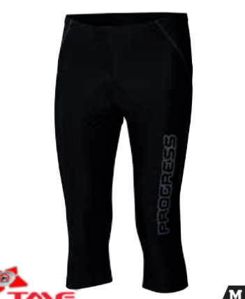
BIKE STUFF REACTIV pánské osmipanelové % elastáky s vložkou M-XXL