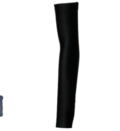
BIKE STUFF ARM návleky na ruce I, II, III