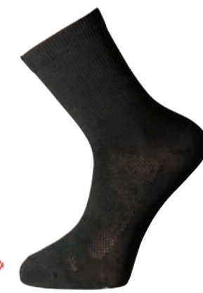
PONOŽKY 3-5, 6-8, 9-12 P MNG MANAGER manažerské ponožky