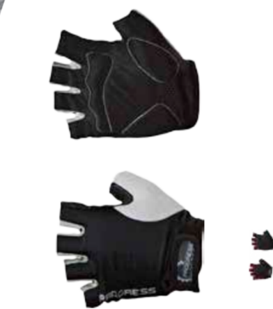
RUKAVICE ..... XS-XXL SIMPLE MITTS ..... XS-XXL

bezprstové rukavice s pěnovými výstelkami na dlaniích