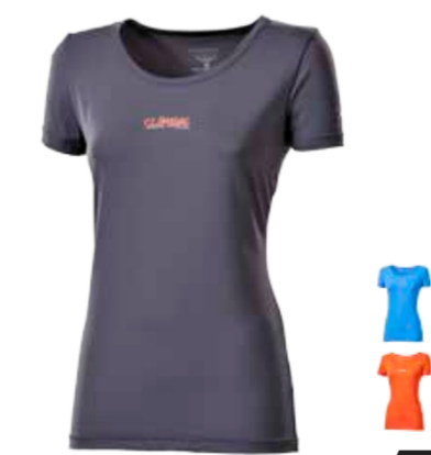
CLIMBING METEORA dámské triko s krátkým rukávem