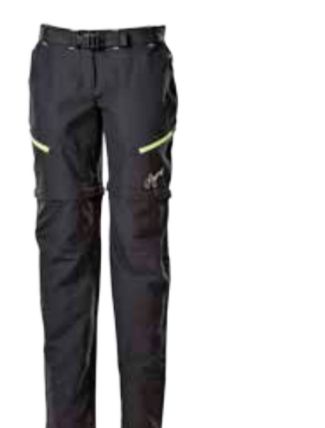
OUTDOOR STUFF SILICA dámské outdoorové kalhoty s odepínacími nohavicemi