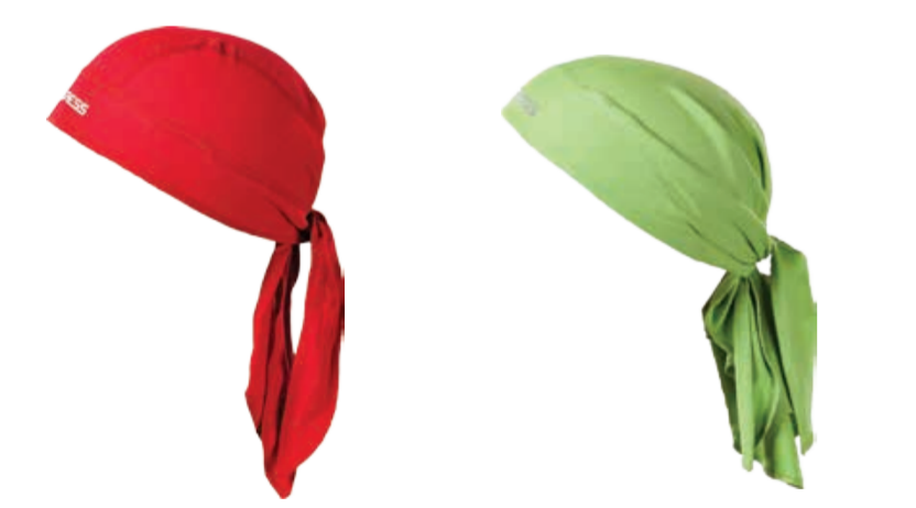
DOPLŇKY ..... UNI D CEZ ..... zavazovací šátek – pirát DOPLŇKY ..... UNI D SAT ..... trojčipý šátek