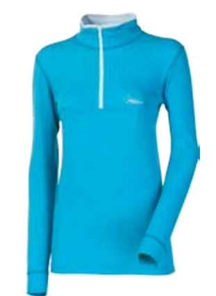
WINTER SENSE WS TRZZ dámské triko s dlouhým rukávem a stojáčkem na zip