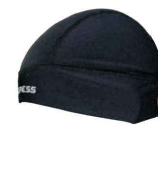
DĚTI UNI DT DCW CEP dětská čepice (Dynamic winter)