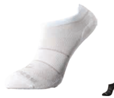
PONOŽKY 3-5, 6-8, 9-12 P LOW LOWLY SOX univerzální nízké letní ponožky