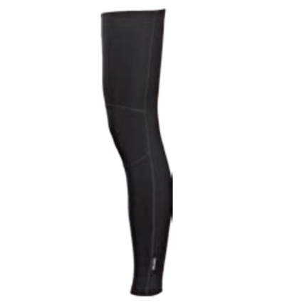
BIKE STUFF LEG + zimní anatomické návleky na nohy I, II, III