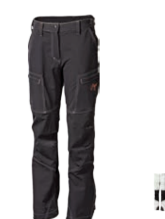
OUTDOOR STUFF QUETTA dámské zateplené turistické kalhoty s Cordurou