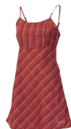
URBAN STYLE ALASKA dámské kostkované šaty