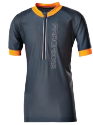
DĚTI 116, 128, 140, 152, 164 FAN dětský cyklošort s krátkými rukávy