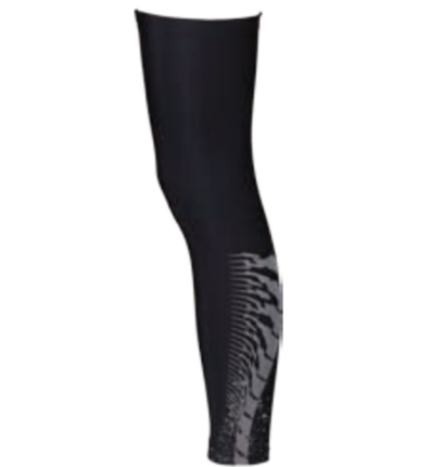
BIKE STUFF LEG P1 návleky na nohy s reflexním potiskem I, II, III