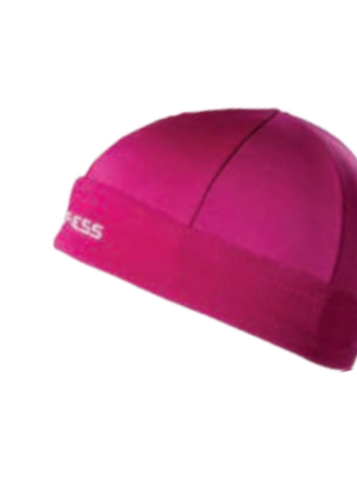
DĚTI UNI DT TS CEP dětská čepice (Tecnostretch)