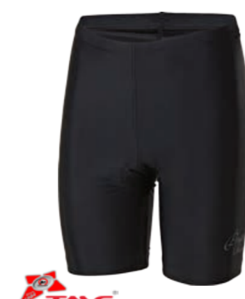
BIKE STUFF SIMPLE L dámské krátké elastáky s vložkou S-XL