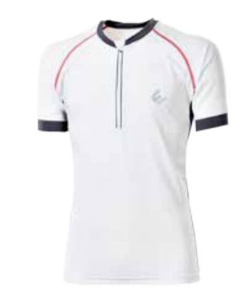
BIKE STUFF SPIDER pánský dres s krátkými rukávy M-XXL