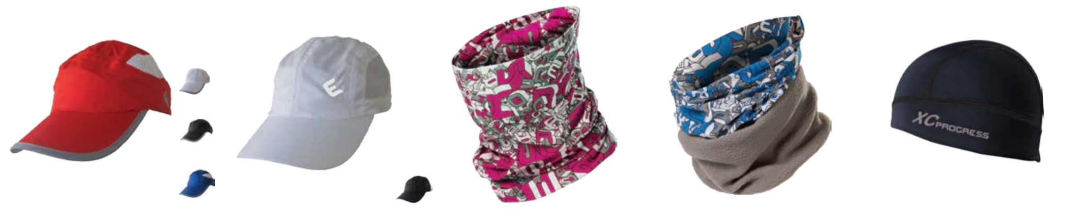
DOPLŇKY ..... UNI TRAINING CAP ..... kšiltovka s odvětráváním DOPLŇKY ..... UNI LITE CAP ..... kšiltovka s odvětráváním DOPLŇKY ..... UNI D TUBE ..... multifunkční tubus DOPLŇKY ..... UNI D TUBE WINTER ..... multifunkční tubus s nápletem DOPLŇKY ..... UNI D XC CEP ..... lehce zateplená běžecká čepice