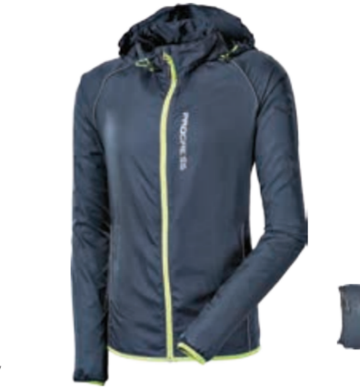
BIKE STUFF AERO BIKE lehká celorožepnicí cyklovětrovka S-XXL