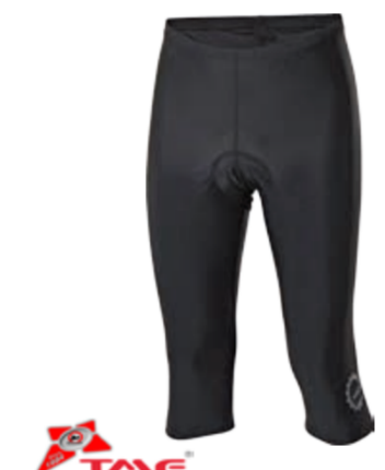
BIKE STUFF SIMPLE M 30 pánské % elastáky s vložkou M-XXL