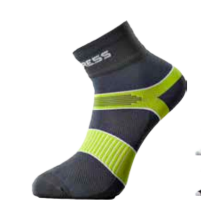
BIKE STUFF P CYC CYCLING SOX cyklistické ponožky 3-5, 6-8, 9-12