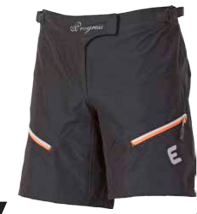
BIKE STUFF MERCY SHORTS dámské bikové šortky s odepínacími elastáky s vložkou S-XL