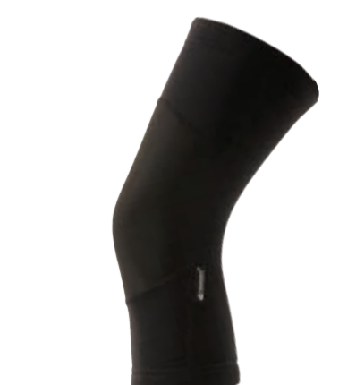
BIKE STUFF KNEE ULTRA zimní návleky na kolena se softshellovou membránou I, II, III