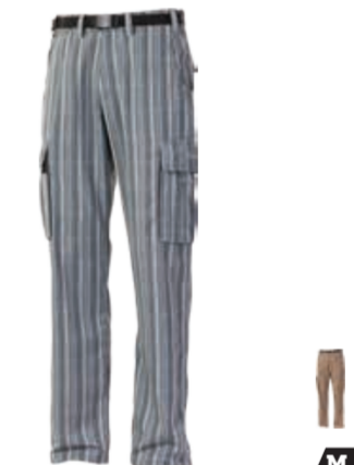
OUTDOOR STUFF OREB pánské kostované kalhoty