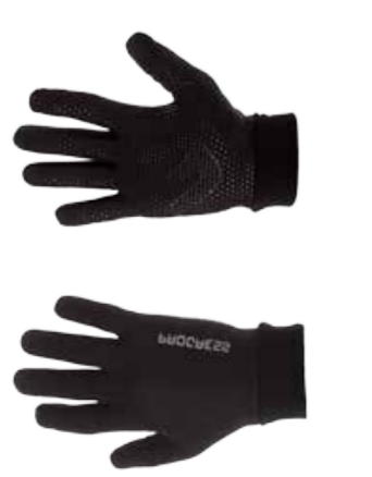
RUKAVICE ..... XS-XXL WINDY ..... M

tenké rukavice s větruodolnou membránou a silikonem na dlaniích