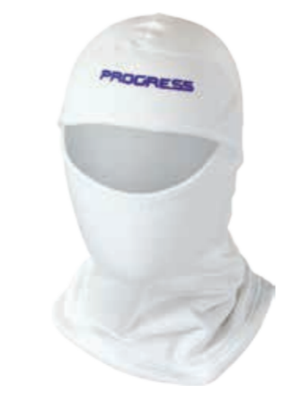
DĚTI UNI DT TS KUK dětská kukla (Tecnostretch)