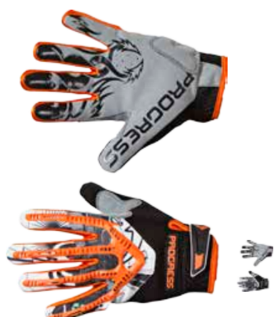
RUKAVICE ..... S-XXL FREERIDE GLOVES ..... S-XXL

dámské bezprstové rukavice s gelovými plochami a silikonem na dlaniích