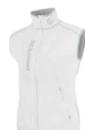
TECNOSTRETCH TARA dámská vesta