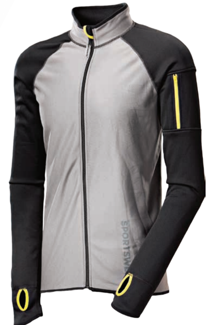
URBAN STYLE GASPAR pánská celopropínací mikina