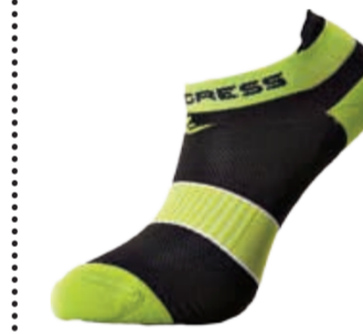
PONOŽKY 3-5, 6-8, 9-12 P SNK SNAKER SOX univerzální nízké letní ponožky