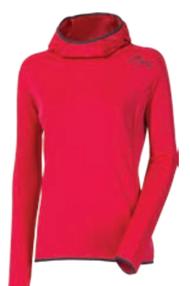
URBAN STYLE KAYA dámská mikina s kapucí