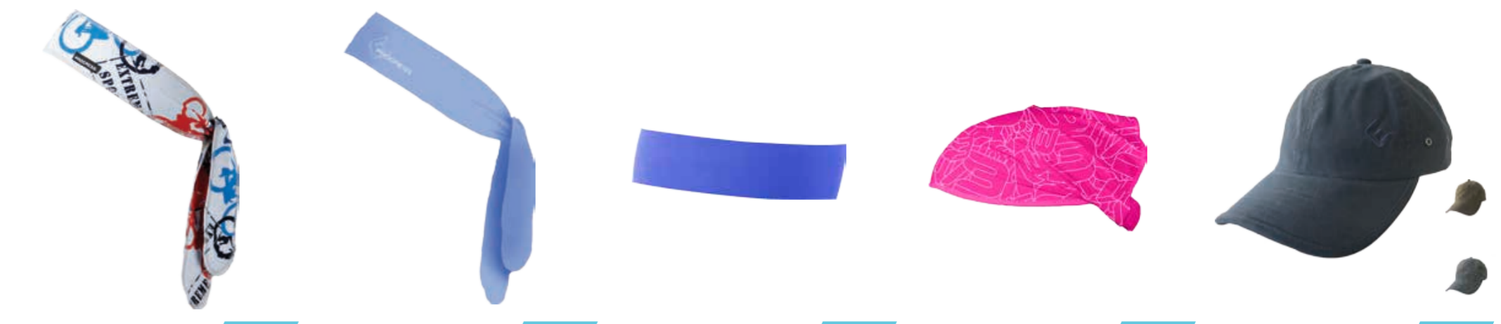
DOPLŇKY ..... UNI D CEL TISK ..... čelenka s potiskem DOPLŇKY ..... UNI D TR CEL ..... čelenka zavazovací (Training stuff) DOPLŇKY ..... UNI D TR CEA ..... čelenka (Training stuff) DOPLŇKY ..... UNI D TR CEG ..... čelenka s gumičkou (Training stuff) DOPLŇKY ..... UNI OUTDOOR CAP ..... kšiltovka