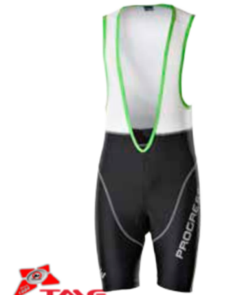
BIKE STUFF AIR BIB osmipanelové krátké elastáky se síťovanými zády a vložkou S-XXL