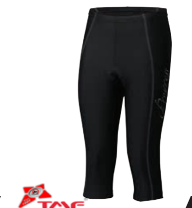
BIKE STUFF ELLENIS dámské šestipanelové % elastáky s vložkou S-XL