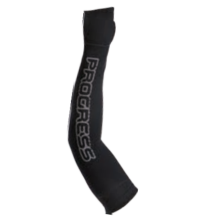
BIKE STUFF ARM + P1 zimní návleky na ruce s reflexním potiskem I, II, III