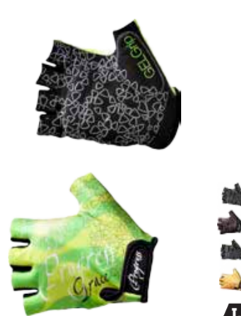
RUKAVICE ..... XS-L GRACE MITTS ..... XS-L

pánské bezprstové rukavice s gelovými plochami a silikonem na dlaniích