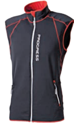
TECNOSTRETCH TARTAR pánská vesta