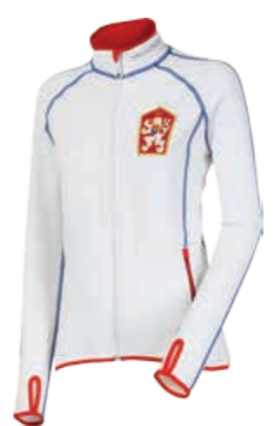
TECNOSTRETCH TIMURA dámská celopropínací mikina s reprezentativní retro mikina