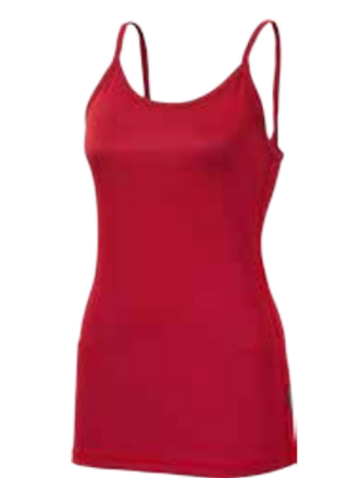
MICROSENSE MS NKOZ dámská košilka