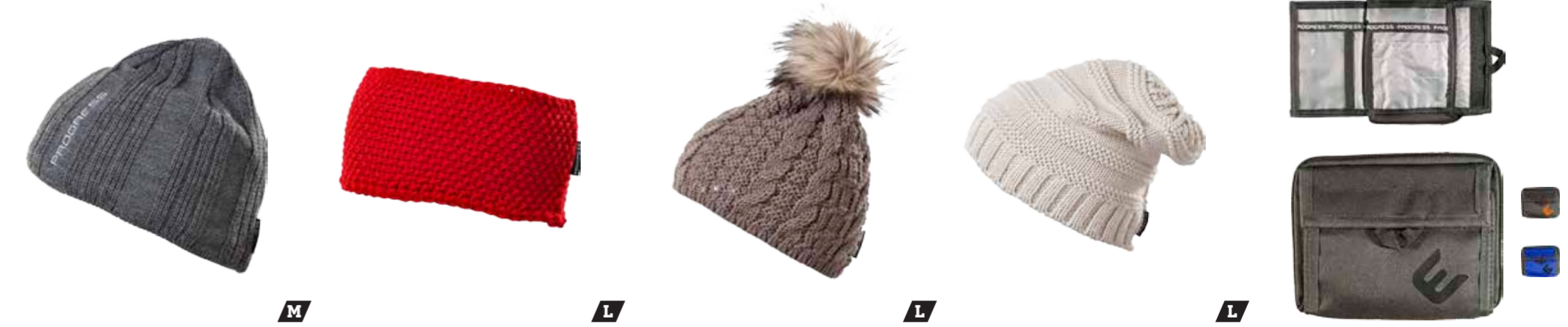
DOPLŇKY ..... M D CIVIL ..... pánská pletená čepice DOPLŇKY ..... L D TIARA ..... dámská pletená čelenka DOPLŇKY ..... UNI D POMPONA ..... dámská pletená čepice s bambulí DOPLŇKY ..... L D ALTA ..... dámská pletená čepice DOPLŇKY ..... UNI D PEZ ..... peněženka na zip