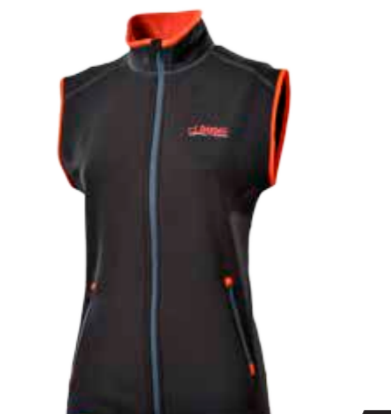
CLIMBING TARA ROCK dámská vesta