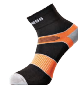
PONOŽKY 3-5, 6-8, 9-12 P CYC CYCLING SOX cyklistické ponožky