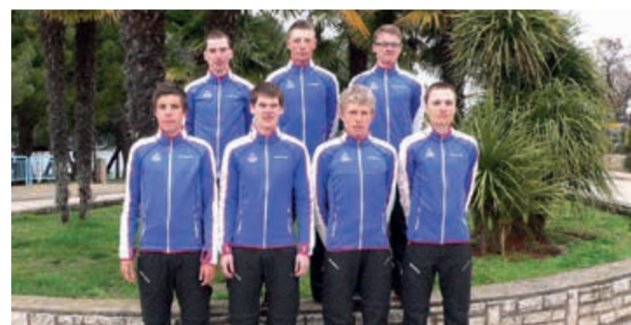
◀ TJ FAVORIT BRNO silniční cyklistika