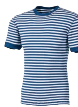
MICROLIGHT MLS NKR pánský nátečník s krátkým rukávem