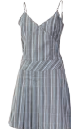
URBAN STYLE NELA dámské kostkované šaty