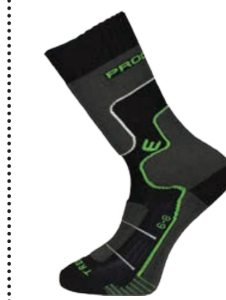
PONOŽKY 3-5, 6-8, 9-12 P TRK TREKKING trekkingové ponožky s Merinom