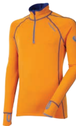
TECNOSTRETCH TAMIL pánská mikina se stojákem na zip