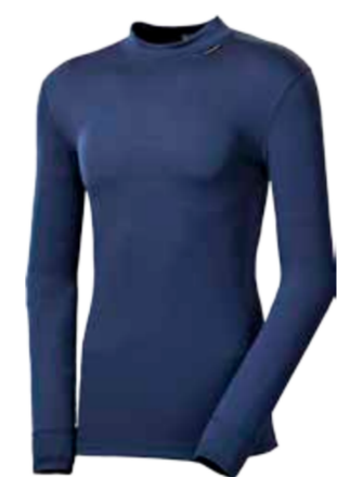
MICROSENSE MS NDR pánský nátečník s dlouhým rukávem