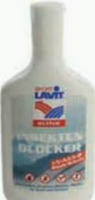
OŠETŘUJÍCÍ PROSTŘEDKY ..... 200 ML

DUSCH FIT Sprchový gel s dlouhotrvajícím chladivým efektem díky své mentolové složce. Zároveň osvěžující díky kofeinové složce.