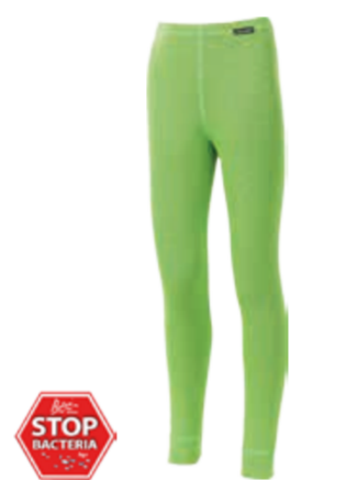
DĚTI 116, 128, 140, 152, 164 MS SDND dětské dlouhé spodky