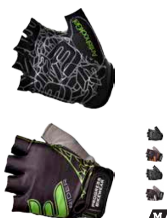
RUKAVICE ..... S-XXL RIDER MITTS ..... S-XXL

bezprstové rukavice s gelem a silikonem na dlaniích a poučky pro snadnější stažení z ruky