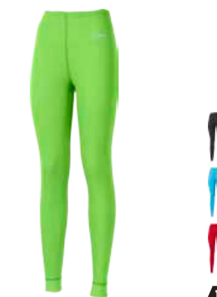
WINTER SENSE WS SDNZ dámské dlouhé spodky