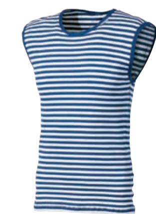
MICROLIGHT MLS NSC pánské scampolo