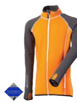
DĚTI 116, 128, 140, 152, 164 TOFFI dětské celopropracováni mikina