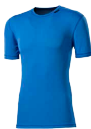
MICROSENSE MS NKR pánský nátečník s krátkým rukávem