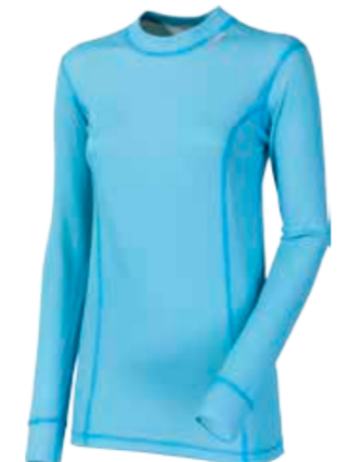
MICROSENSE MS NDRZ dámský nátečník s dlouhým rukávem