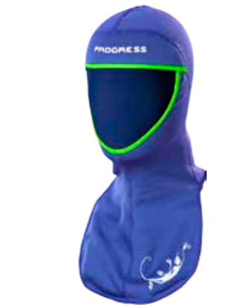
DĚTI UNI DT TS KUN dětská kukla s nákrčníkem (Tecnostretch)