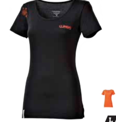
CLIMBING LHASA dámské triko s krátkým rukávem