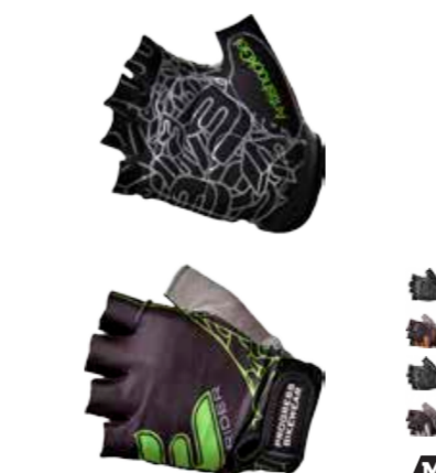
BIKE STUFF RIDER MITTS pánské bezprstové rukavice s gelovými plochami a silikonem na dlaních S-XXL