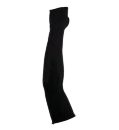
BIKE STUFF ARM + zimní návleky na ruce I, II, III