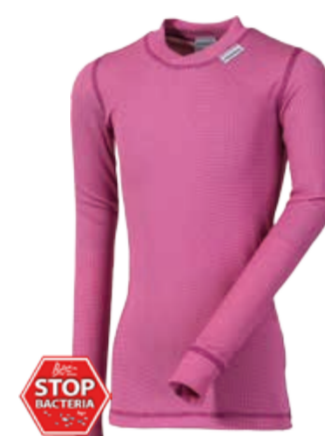
DĚTI 116, 128, 140, 152, 164 MS NDRD dětský nártelník s dlouhým rukávem