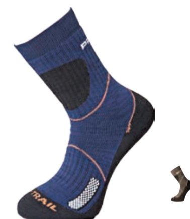
PONOŽKY 3-5, 6-8, 9-12 P XTA X-TRAIL trekkingové ponožky