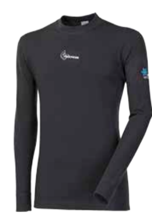
WINTER SENSE WS TDR pánské triko s dlouhým rukávem