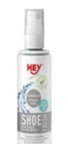
OŠETŘUJÍCÍ PROSTŘEDKY ..... 100 ML

HEY - SHAUM AKTIV REINIGER Aktivní čistící pěna na „suché“ čištění věcí, které se nemohou prát v pračce. Např. batohy, boty, rukavice, helmy, atd.