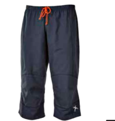
CLIMBING BOULDER 30 pánské lezecké ¾ kalhoty