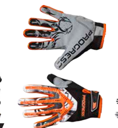
BIKE STUFF FREERIDE GLOVES prstové rukavice s ochrannými prvky kloubů na hřbetu ruky S-XXL