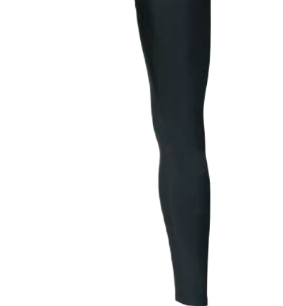
BIKE STUFF LEG návleky na nohy I, II, III