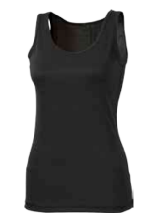
MICROSENSE MS NBRZ dámské tílko