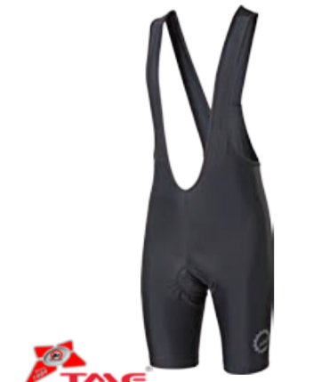
BIKE STUFF SIMPLE M BIB pánské krátké elastáky s kšandami a vložkou M-XXL