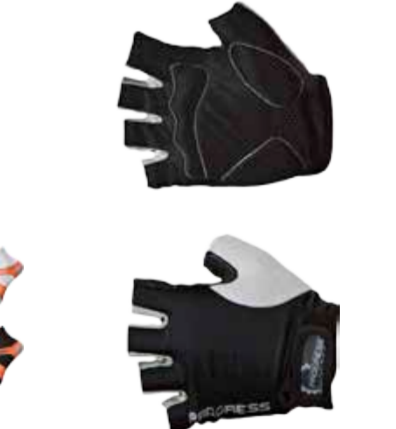
BIKE STUFF SIMPLE MITTS bezprstové rukavice s pěnovými výstelkami na dlaních XS-XXL