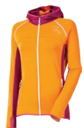
TECNOSTRETCH TIBA dámská celopropínací mikina s kapucí