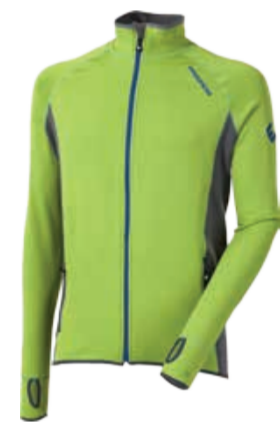
TECNOSTRETCH TOREZ II. pánská celopropínací mikina