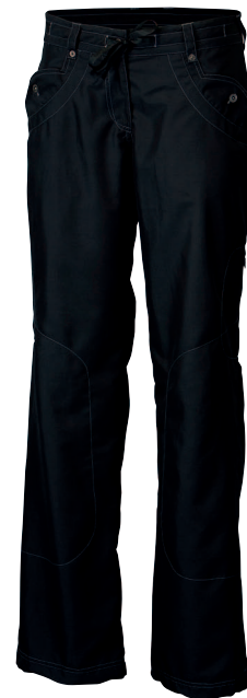
..... OS GARDA ..... DÁMSKÉ RIPSTOPOVÉ KALHOTY • LADIES TROUSERS • DAMENHOSEN ✚ RIPSTOP 100% PES (S-XL)