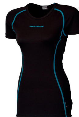
..... DFS NKRZ ..... DÁMSKÝ NÁTĚLNÍK S KRÁTKÝM RUKÁVEM • LADIES SHORT SLEEVE TEE • DAMEN T-SHIRT ✚ 80% POLYESTER + 20% POLYPROPYLEN (S-XL)