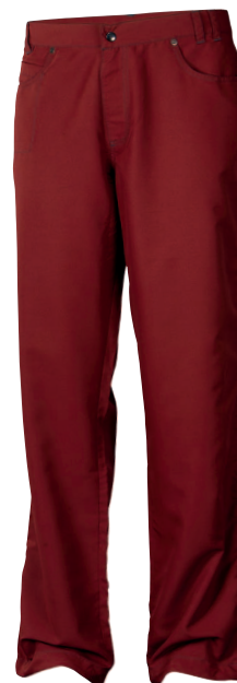
..... OS VICO ..... PÁNSKÉ DLOUHÉ RIPSTOPOVÉ KLAHOTY • MENS TREKKING TROUSERS • TREKKINGSHOSEN + RIPSTOP 100% PES (M-XXL)