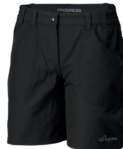
..... OS SAGARMATHA SHORTS ..... DÁMSKÉ RYCHLESCHNOUCÍ KRÁTKÉ KALHOTY S PĚTI KAPSAMI • LADIES TREKKING TROUSERS • DAMEN TREKKINGHOSE ✚ 94% NYLON + 6% SPANDEX (S-XL)