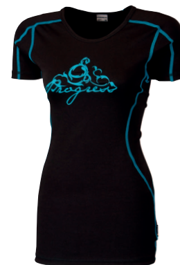
..... DFS TKRZ ..... DÁMSKÉ TRIKO S KRÁTKÝM RUKÁVEM • LADIES SHORT SLEEVE TEE • DAMEN T-SHIRT ✚ 80% POLYESTER + 20% POLYPROPYLEN (S-XL)