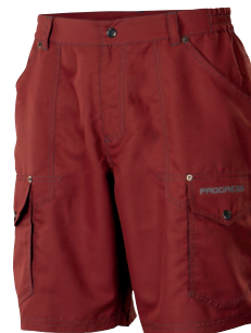
..... OS BARI ..... PÁNSKÉ OUTDOOROVÉ RIPSTOPOVÉ KRAČASY • MENS TREKKING SHORTS • TREKKINGSHORTS + RIPSTOP 100% PES (M-XXL)