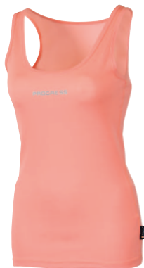
..... DFS NBRZ ..... DÁMSKÉ TÍLKO. PLOCHÉ ŠVY • LADIES SCOOP NECK TEE • DAMEN TRÄGERTOP ✚ 80% POLYESTER + 20% POLYPROPYLEN (S-XL)