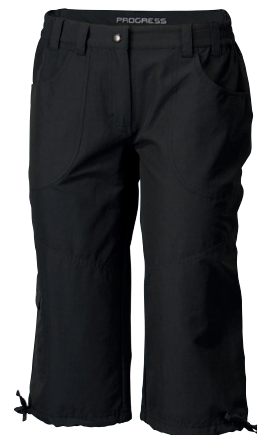
..... OS SAGARMATHA 3Q ..... DÁMSKÉ RYCHLESCHNOUCÍ TRÍČTVRTEČNÍ KALHOTY S PĚTI KAPSAMI A STAHOVACÍ ŠŤŮRKOOU NA KONCI NOHAVIC • LADIES TREKKING 3/4 TROUSERS • DAMEN 3/4 TREKKINGHOSE ✚ 94% NYLON + 6% SPANDEX (S-XL)