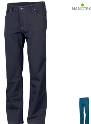
Urban Stuff CHAMONIX P S-XXXL černá S-XL modrá ČERNÁ • TMAVÉ MODRÁ