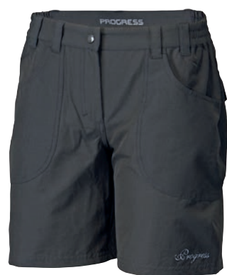
Outdoor Stuff SAGARMATHA Shorts ČERNÁ