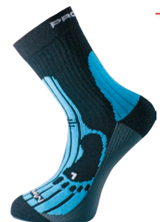
Ponožky ..... P MRN Merino ČERNÁ / ORANŽ. / BORDO • ČERNÁ / MODRÁ / ŠEDÁ • ČERNÁ / TYRKYS / ŠEDÁ