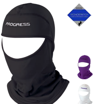
Děti ..... DT TS KUK uni ČERNÁ • BILÁ • FIALOVÁ