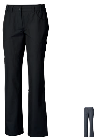
Outdoor Stuff SAGARMATHA ČERNÁ • ŠEDÁ