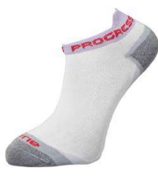
Ponožky ..... P FOT Footie 3-5, 6-8, 9-12 BÍLÁ / FIALOVÁ / ŠEDÁ • BÍLÁ / PETROL / ŠEDÁ ČERNÁ / PETROL / ŠEDÁ