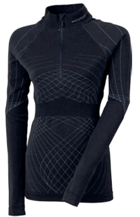
Seamless ..... SLw NRZZ merino D M-XL ČERNÁ / ŠEDÁ