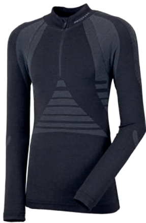
Seamless ..... SLw NRZ merino P M-XXL ČERNÁ / ŠEDÁ