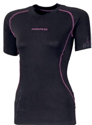
Bamboo Collection E NKRZ ČERNÁ / FIALOVÉ PROŠ. D S-XL

Bambus Faser erscheint im ersten Moment des Anfassens kühl. Jedoch isoliert. Antibakteriell und antistatisch. Bambusgarn ist weich — Keine Rucksack mit Bambus T-Shirt!