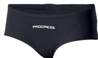
Dynamic ..... DOTTY D S-XL ČERNÁ • SV. ZELENÁ