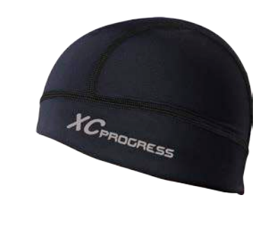
Doplňky ..... D XC CEP uni ČERNÁ