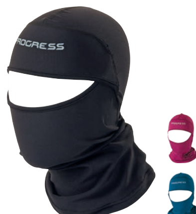
Děti ..... DT DCw KUK uni ČERNÁ • PETROL • FIALOVÁ