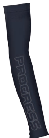
Bike Stuff ARM P1 U I, II, III ČERNÁ