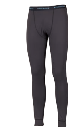
Dynamic ..... WALKER P M-XXL ČERNÁ • PETROL