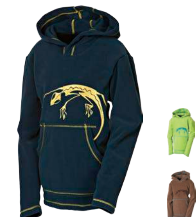
Děti ..... MIKKI 116-164 ZELENÁ / SV. MODRÁ • HNĚDÁ / SV. MODRÁ • PETROLEJOVÁ / ŽLUTÁ