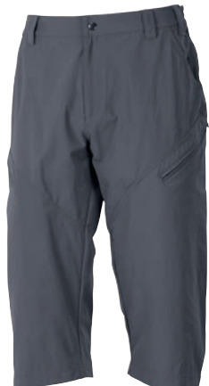
Outdoor Stuff CHADAR 3Q ČERNÁ • ŠEDÁ