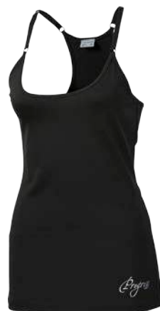
Training Stuff TAYRA ČERNÁ • PISTÁCIOVÁ • FIALOVÁ