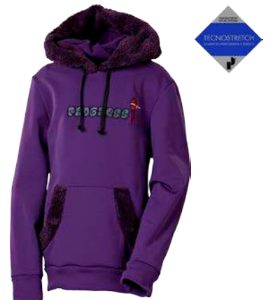
Děti ..... ZAJDA 116-164 FIALOVÁ