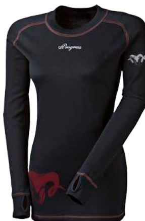
Merino ..... M TDRZ D S-XL ČERNÁ / TM.BORDÓ PROŠ.