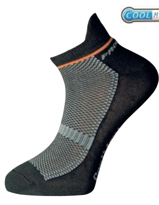
Ponožky ..... P CCO Cyklo CoolMax ČERNÁ • BÍLÁ