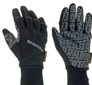
Rukavice ..... SNOWRIDE Gloves XS-XXL ČERNÁ