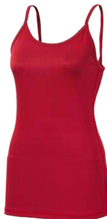
Microsense MS NKOZ ČERNÁ • BÍLÁ • BORDÓ