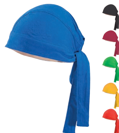
Doplňky ..... D CEZ S, XL DLE NABÍDKY