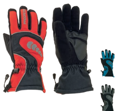
Rukavice ..... DEFROST Gloves XS-XXL ČERNÁ / ČERVENÁ • ČERNÁ / ŠEDÁ • ČERNÁ / SV. MODRÁ