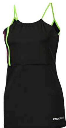
Training Stuff FAYA ČERNÁ • FIALOVÁ