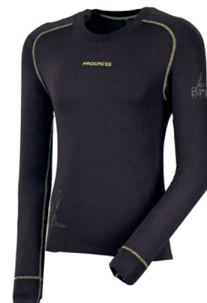
Bamboo Collection E NDR ČERNÁ / SV. ZELENÉ PROŠ. P M-XXL