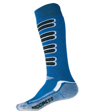
Děti ..... XKH X-Kid High 30-34, 35-38 MODRÁ