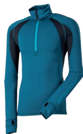
Dynamic ..... WARAN P M-XXL ČERNÁ/PETROL/ORANŽ.PROŠ. • PETROL / SV. MODRÉ PROŠ.