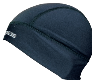
Doplňky ..... D DC CEP uni ČERNÁ • PETROLEJOVÁ • FIALOVÁ