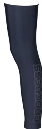
Bike Stuff LEG P1 U I, II, III ČERNÁ