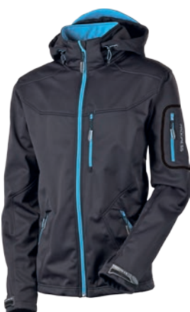
Outdoor Stuff MASHEBRUM II Softshell 10000/10000 ČERNÁ / MODŘÉ DOPLŇKY