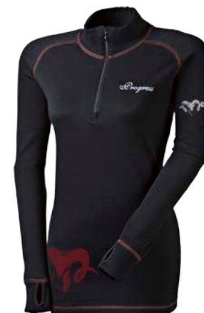
Merino ..... M TRZZ D S-XL ČERNÁ / TM.BORDÓ PROŠ.