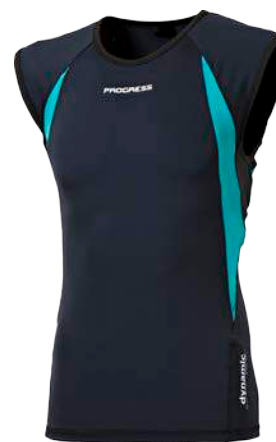
Dynamic ..... DIGGER P M-XXL ČERNÁ / ZELENÁ • ZELENÁ / ČERNÁ