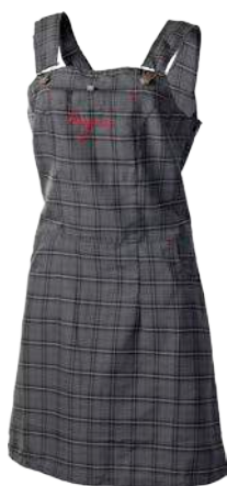
Outdoor Stuff AMENITY ČERNÁ KOSTKA