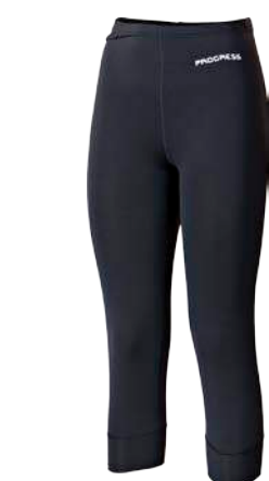
Dynamic ..... WINTA 3Q D S-XL ČERNÁ / BÍLÝ TISK