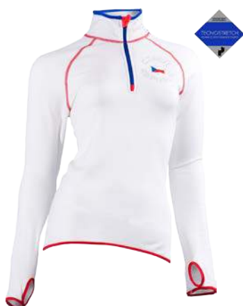
Czech Edition ČR mikina ženy D S-XL Mikina z kolekce Tecnostretch