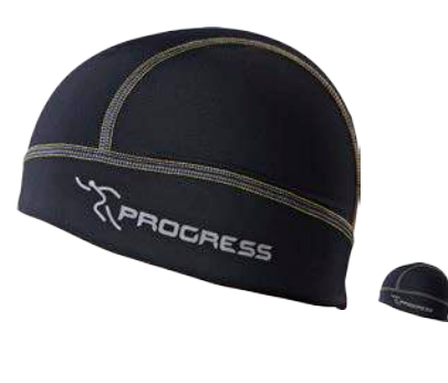
Doplňky ..... D RS CEP uni ČERNÁ • ČERNÁ / ŽLUTO-ŠEDÉ PROŠ.