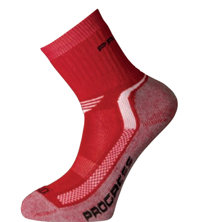
Děti ..... XKD X-Kid 30-34, 35-38 ČERVENÁ