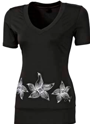
Training Stuff LOMA ČERNÁ • PISTÁCIOVÁ • FIALOVÁ