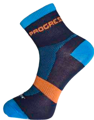
Ponožky ..... P RDS Rider sox ČERNÁ / ŠEDÁ / ČERVENÁ • ŠEDÁ / ČERVENÁ ČERNÁ / MODRÁ