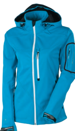
Outdoor Stuff DHAULAGIRI II Softshell 10000/10000 MODŘÁ / BÍLÉ DOPLŇKY