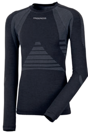
Seamless ..... SLw NDR merino P M-XXL ČERNÁ / ŠEDÁ