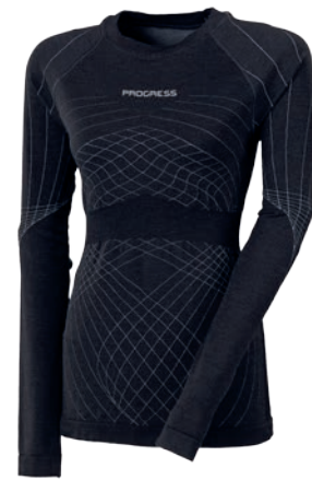
Seamless ..... SLw NDRZ merino D M-XL ČERNÁ / ŠEDÁ