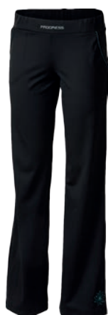
Training Stuff LEVIGA ČERNÁ