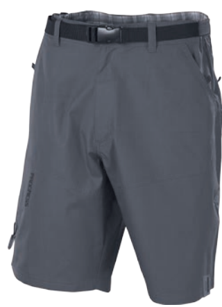
Outdoor Stuff ZASKAR ŠEDÁ