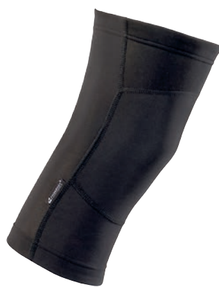
Bike Stuff KNEE + U I, II, III Zateplené návleky na kolena ČERNÁ