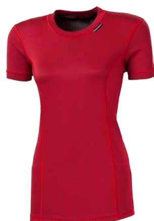
Microsense MS NKRZ ČERNÁ • BÍLÁ • BORDÓ

Neues Material ist hoch funktional und langlebig, komfortabel wie die erste Schicht Unterwäsche zu tragen.