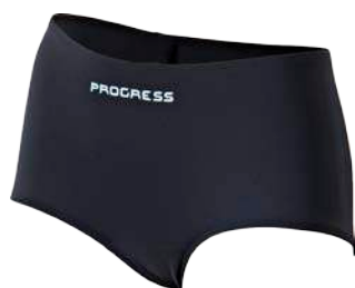
Dynamic ..... DONA D S-XXL ČERNÁ