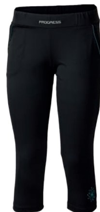
Training Stuff LEVANA ČERNÁ