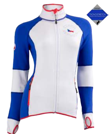
Czech Edition ČR mikina ženy D S-XL Mikina z kolekce Tecnostretch