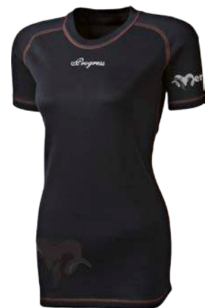
Merino ..... M TKRZ D S-XL ČERNÁ / TM.BORDÓ PROŠ.