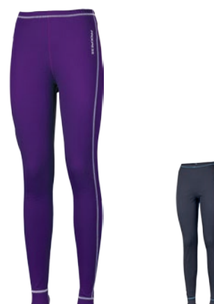
Dry Fast DFc SDNZ ČERNÁ / SV. MODRÉ PROŠ. • FIALOVÁ / SV. ŠEDÉ PROŠ.