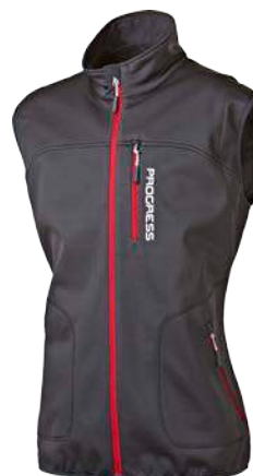
Outdoor Stuff TRIGLAV VEST Softshell 7000/3000 ČERNÁ / ČERVENÁ