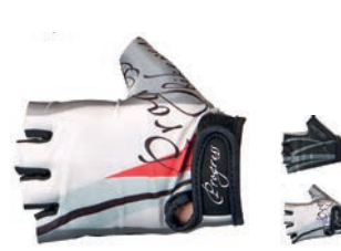
Rukavice ..... GRACE mitts XS-L ČERNÁ / ČERVENÝ TISK • ČERNÁ / FIALOVÝ TISK