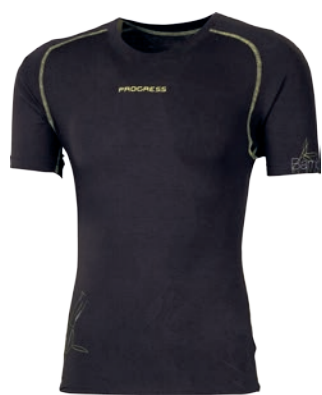
Bamboo Collection E NKR ČERNÁ / SV. ZELENÉ PROŠ. P M-XXL