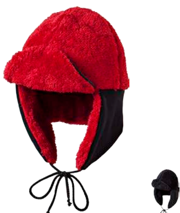
Urban Stuff USCHANKA U uni ČERNÁ • BORDÓ / ČERNÁ