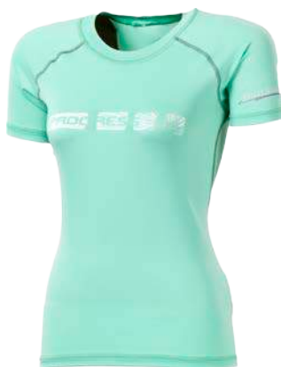
Dynamic ..... DARYA N D S-XL ČERNÁ / SV. ZELENÉ PROŠ. • SV. ZELENÁ / ŠEDÉ PROŠ.