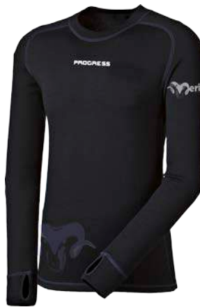
Merino ..... M TDR P M-XXL ČERNÁ / TM.MODRÉ PROŠ.