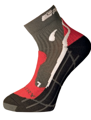
Ponožky ..... P XCN X-Country ŠEDÁ / ČERVENÁ / BÍLÁ • ŠEDÁ / BÍLÁ / ČERVENÁ