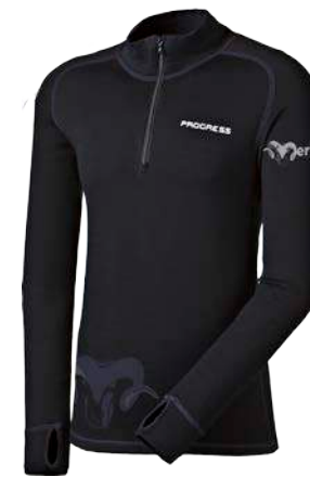
Merino ..... M TRZ P M-XXL ČERNÁ / TM.MODRÉ PROŠ.