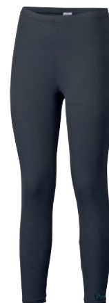
Training Stuff FILAGA ČERNÁ