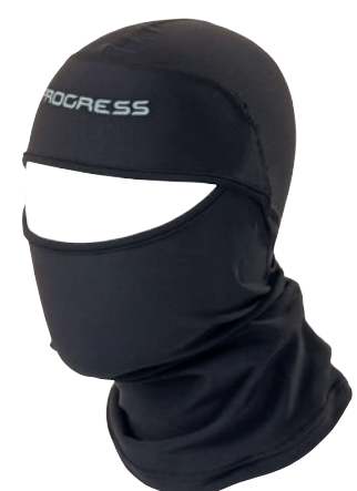
Doplňky ..... D DC KUK uni ČERNÁ • PETROLEJOVÁ • FIALOVÁ