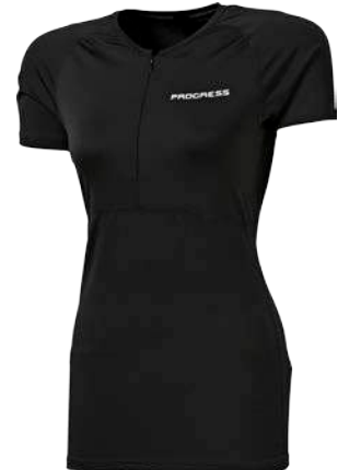
Training Stuff TINA ČERNÁ • PISTÁCIOVÁ • FIALOVÁ