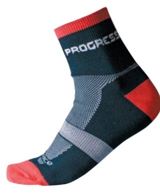
Ponožky ..... P GRS Grace sox ČERNÁ / ŠEDÁ / ČERVENÁ • BÍLÁ / FIALOVÁ / ŠEDÁ BÍLÁ / MODRÁ