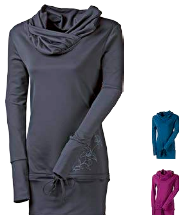
Urban Stuff MAYA D S-XL Pulover z materiálu Dynamic ČERNÁ • PETROLEJOVÁ • FIALOVÁ