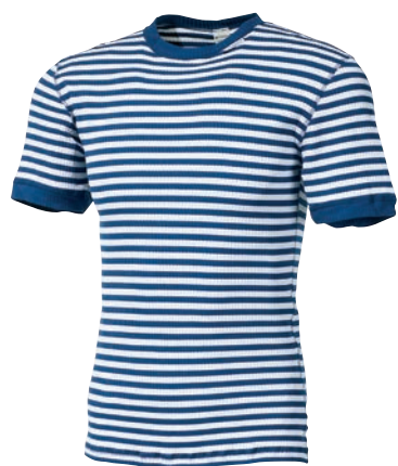
Microlight Special MLs NKR PROUZEK MODRÁ/BÍLÁ