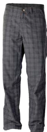
Outdoor Stuff CHESS ČERNÁ KOSTKA