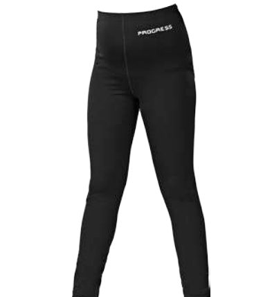
Děti ..... PIPI 116-164 ČERNÁ