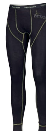
Bamboo Collection E SDN ČERNÁ / SV. ZELENÉ PROŠ. P M-XXL