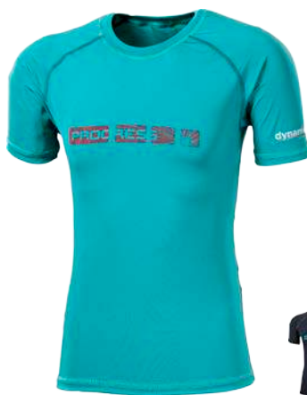
Dynamic ..... DESPOT N P M-XXL ČERNÁ / ŠEDÉ PROŠ. • ZELENÁ / ŠEDÉ PROŠ.