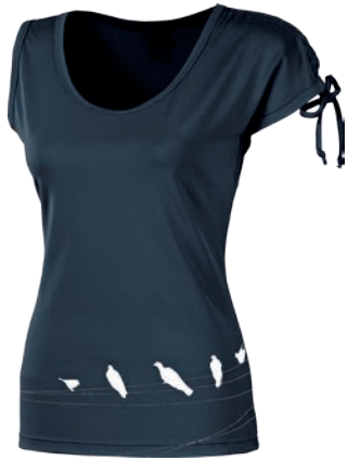
Training Stuff LUNA ČERNÁ

Mode hauptsächlich für die „Indoor“ Aktivitäten. Komfort ist wichtig in dieser Collection.