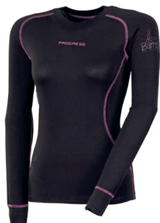
Bamboo Collection E NDRZ ČERNÁ / FIALOVÉ PROŠ. D S-XL