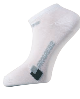
Ponožky P LIT Lite BÍLÁ / ŠEDÁ • ČERNÁ / TYRKYSOVÁ