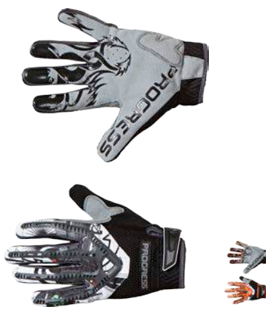
Rukavice FREERIDE Gloves S-XXL ČERNÁ / BÍLÁ / ŠEDÁ • ČERNÁ / BÍLÁ / ORANŽOVÁ