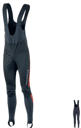
Bike Stuff ZEPHYR P M-XXL Softshell na předních dílech ČERNÁ / ČERVENÁ • ČERNÁ / ŠEDÉ SVY