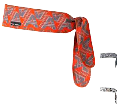
Doplňky ..... D CEL tisk U S, XL SMOG • KOMIKS • AAA