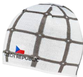
Czech Edition ČR pletená čepice U uni