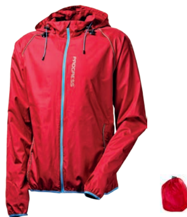
Bike Stuff AERO Bike U S-XXL Lehká větrovka ČERVENÁ / MODRÁ