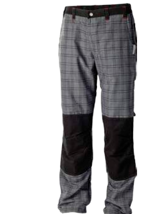
Outdoor Stuff IMP ČERNÁ KOSTKA