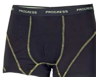
Bamboo Collection E SKN ČERNÁ / SV. ZELENÉ PROŠ. P M-XXL