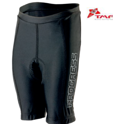
Děti ..... BEE 116-152 ČERNÁ