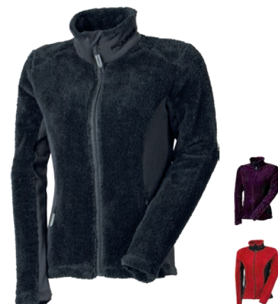
Urban Stuff CASTORA D S-XL ČERNÁ • BORDÓ / ČERNÁ • FIALOVÁ / ČERNÁ