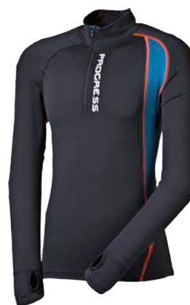
Dynamic ..... WORRY P M-XXL ČERNÁ/PETROL/ORANŽ.PROŠ. • PETROL / SV. MODRÉ PROŠ.