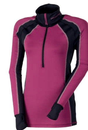
Dynamic ..... WICKI D S-XL PETROL/ČERNÁ/BÍLÉ PROŠ. • FIALOVÁ/ČERNÁ/BÍLÉ PROŠ.