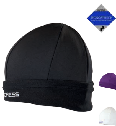
Děti ..... DT TS CEP uni ČERNÁ • BILÁ • FIALOVÁ