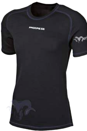
Merino ..... M TKR P M-XXL ČERNÁ / TM.MODRÉ PROŠ.