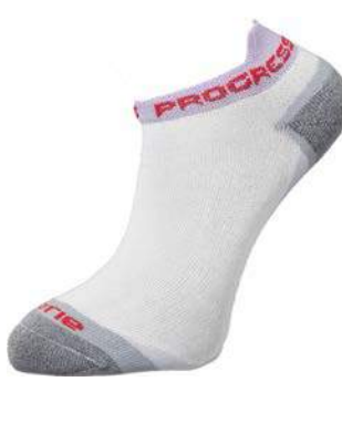
Ponožky P FOT Footie BÍLÁ / FIALOVÁ / ŠEDÁ • BÍLÁ / PETROL / ŠEDÁ ČERNÁ / PETROL / ŠEDÁ