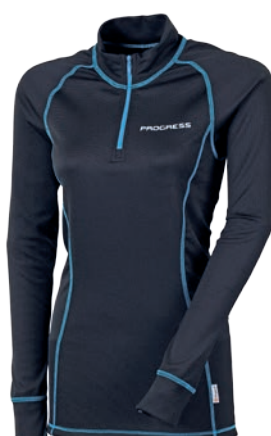
Dry Fast DFc NRZZ ČERNÁ / SV. MODRÉ PROŠ. • FIALOVÁ / SV. ŠEDÉ PROŠ.