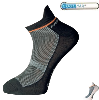
Ponožky P CCO Cyklo CoolMax ČERNÁ • BÍLÁ 3-5, 6-8, 9-12