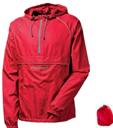
Outdoor Stuff AERO Trek Lehká větrovka ČERVENÁ / ŠEDÁ