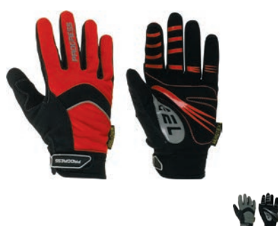
Rukavice ..... GEL Gloves XS-XXL ČERNÁ / ČERVENÁ • ČERNÁ / ŠEDÁ