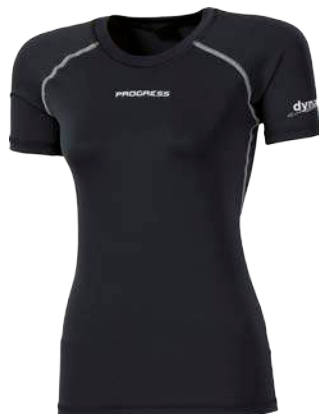
Dynamic ..... DIZZY D S-XL ČERNÁ / SV. ZELENÉ PROŠ. • SV. ZELENÁ / FIALOVÉ PROŠ.