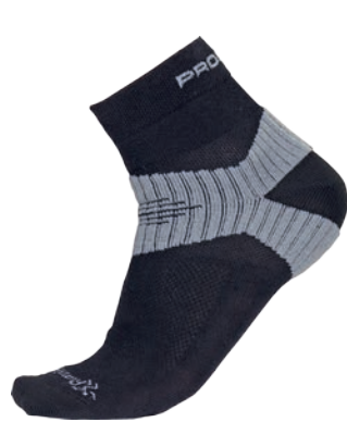
Ponožky ..... RSX Running sox ČERNÁ / ŠEDÁ • ČERNÁ / ŽLUTÁ • BÍLÁ / ČERNÁ